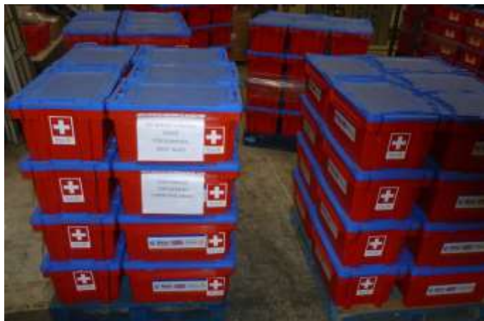
Water Survival Boxes paid by Switzerland prepared for Shipment

A second consignment of 100 boxes was requested by the Rotary Club of Plymouth in Dominica to be distributed to the most vulnerable people (as with the first consignment). However, in the absence of an operational airport the consignment would travel by sea and for some weeks the port of Roseau was log-jammed with containers preventing further goods from being off-loaded.