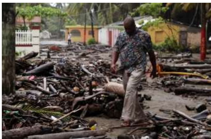
Thousands of people without drinking water after the Hurricane Irma

In the second week of September Category 5 (highest) Hurricane Irma caused massive damage as it tracked north through the Caribbean islands of which Anguilla, British Virgin Islands, and St Maarten were among the worst affected. Virtually all homes were destroyed, or severely damaged and normal sources of safe drinking water were inaccessible or became contaminated. Ten days later a second category 5 Hurricane Maria caused further extensive damage to most of the islands that had been spared from Irma – one of the worst affected of these being the island of Dominica in the Lesser Antilles.